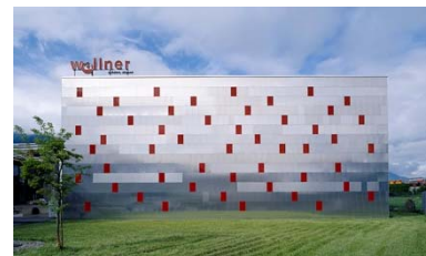
Lagerhalle Wallner, Scheifling 2005