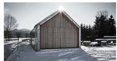
Kleinwasserkraftwerk Fuschler Ache, Thalgau 2011