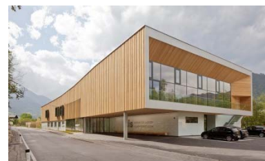
Zentrum für Inklusiv- und Sonderpädagogik, St. Johann im Pongau 2015