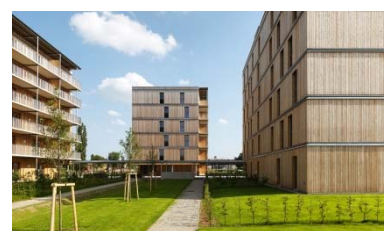
Wohnbau Hummelkasern, Graz 2016