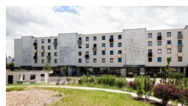
Wohnanlage Grüne Mitte Linz, Linz 2016