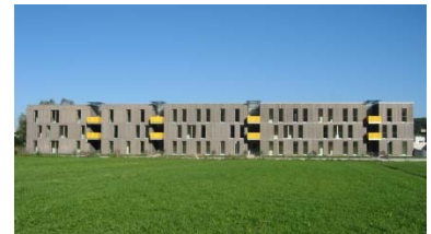
Passivwohnhaus Samer Mösl, Salzburg 2006