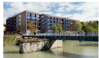
Seniorenwohnhaus, Hallein 2013