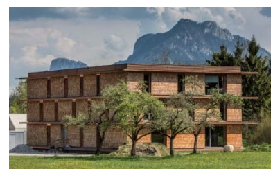
Kulturkraftwerk oh456, Thalgau 2014