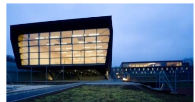
Sportpark Lissfeld, Linz 2010