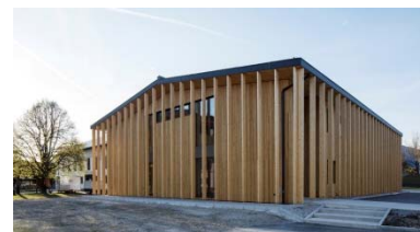
Agrarzentrum Maishofen, 2016