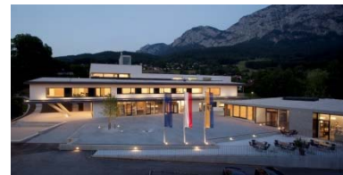
Gemeindezentrum Steinbach am Attersee 2012